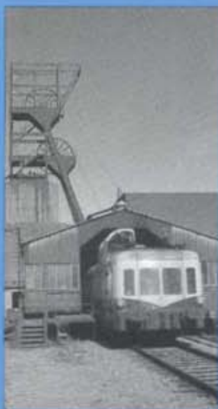
TOURISTISCHE BAHNFABRIK AUF DEM GLEIS 125 DER BAHNHOF- EINGANGSSTRAÙE DES LORRAINISCHEN KOBLENZERS