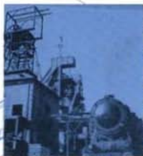
REPARATURWERKSTATT VON 1895 BIS 2010

Die Umkleeräume, die Lampenstube, die Werkstätten zeigen eher das Element «Mensch» in dieser Industrielandschaft, bezeugt von Generationen, die tagtäglich zur Schicht fuhren. Ein unwandelbarer Rhythmus, der sich in einem Gebäude absolvierte, das sich stetig vergrößerte, ohne sich jedoch wirklich zu verändern.