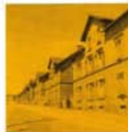
CITÉS MINIÈRES