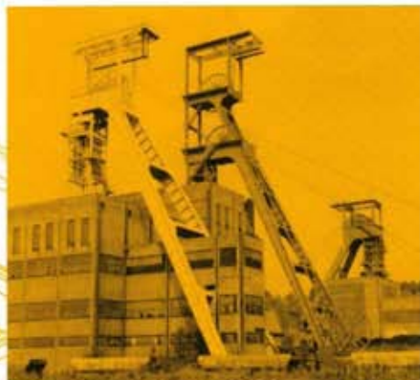
TROIS CHEVALEMENTS DU SIÈGE WENDEL PROFONDEUR DES PUIITS : DE 800 A 900 M.

Situé au Nord-Est du bassin houiller lorrain, le carreau Wendel est un ancien siège d'extraction et de traitement du charbon exploité de 1856 à 1986. Les installations industrielles construites lors de la formidable extension qui a suivi la nationalisation de 1946, y côtoient des bâtiments datant de l'époque des compagnies privées. Comprenant cinq puits, il produisait plus de 10.000 tonnes de charbon par jour et employait 5.000 mineurs.