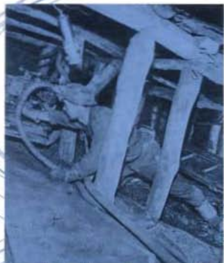
DIE ANFÄNGE DER MECHANISIERUNG DES KOHLEABBAUS, 1890.

Die Preise umfassen die Kosten für Organisation, Begleitung und Eintritt, aber nicht die Mahlzeiten und Transport.