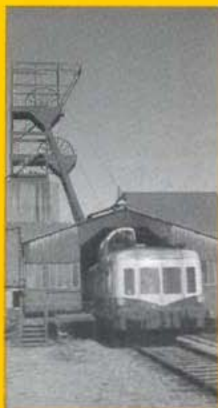
CIRCUIT DE TOURISME FERROVIAIRE SUR UNE PARTIE DE L'ANCIEN RESEAU DES HOUILLERS DU BASIN DE LORRAINE.