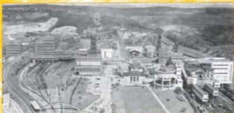
VUE ARRIVÉE DU CARREAU WENDEL