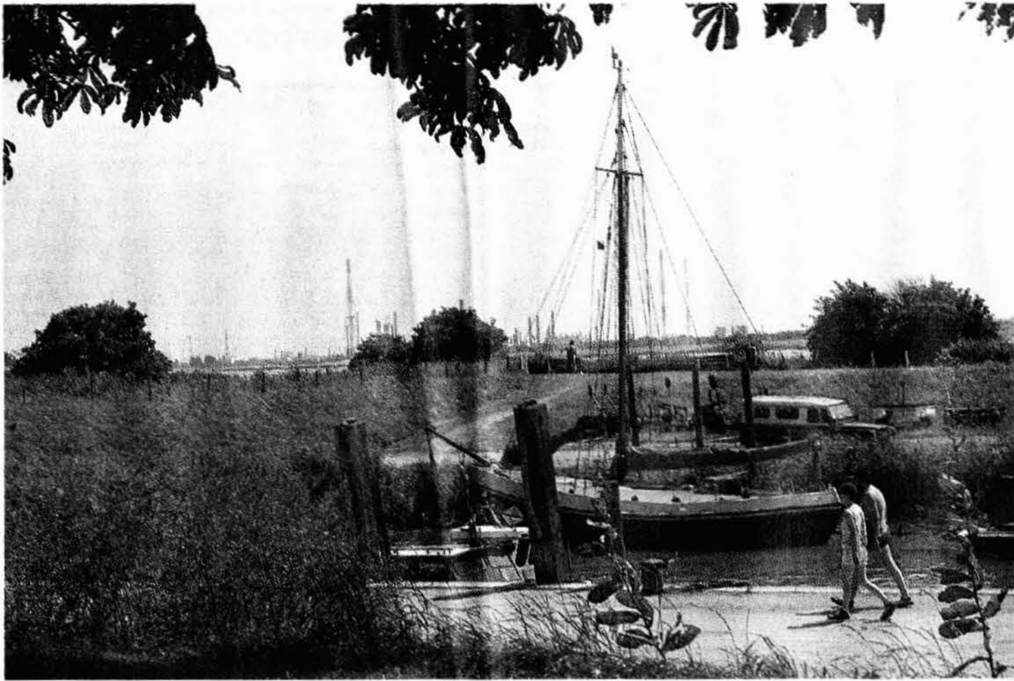
Contrast aan de Schelde: het schilderachtige getijdenhaventje van Lillo-Fort en brakende pijpen van de chemische industrie.

De expansiedrift van de Antwerpse haven betekende in de jaren 60 het einde van de Belgische polderdorpen Oosterweel, Oorderen, Wilmarsdonk en Oud-Lillo/Lillo-Kruisweg. Ze liggen begraven onder een dikke laag baggerzand én onder de fundamenteën van vestigingen van multinationals als Bayer, BASF, Solvay, Degussa en Monsanto. Eén gehucht hield echter stand: Lillo-Fort, een 419 jaar oud buitenbeentje aan de Schelde.