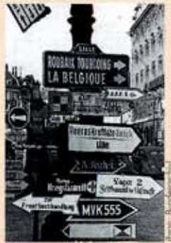
Lille tijdens de Duitse bezetting

In de "Coupole", symbool van de verschrikkelijke gevaren van vroeger, vindt u een overzicht van de levensomstandigheden tijdens de bezetting: de zo moeilijke jaren 40 in het Noorden van Frankrijk.