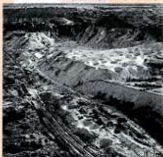
Luchtfoto van de "Coupole" op 4 november 1944

Terwijl de ontwikkeling van de geheime wapens vordert, wordt in Helfaut, dichtbij Saint-Omer in streek Pas-de-Calais, één van de meest indrukwekkende bunkers vervaardigd. Honderden Russische en Poolse gevangen werken hier onder bijzonder slechte omstandigheden.