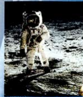
Edwin Aldrin op de maan. Apollo Missie 11 juli 1969