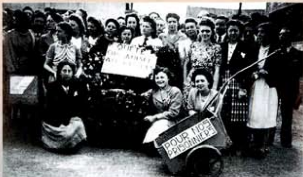
Inzameling van geld en voedingsmiddelen voor de mannen die in Duitsland gevangens zitten