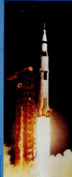
Cape Kennedy, lancering van de Saturn 5 in 1969

Het Historisch Centrum legt eveneens de nadruk op de ruimtevaart van 1945 tot 1969 (de eerste mens op de maan). U kunt de belangrijke gebeurtenissen van deze naoorlogse verovering herleven, van de eerste Spoetnik tot de Apollo missies. Deze ontdekkingsreis door de kosmos is vandaag de dag een bron van vooruitgang en samenwerking tussen verschillende landen.