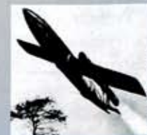
Opstijging van een V1

Paradoxaal hebben deze raketten geleid tot de ontwikkeling van de ruimtevaart. De raketten van de koude oorlog en de Amerikaanse, Sovjet-Russische en Europese ruimtevaartprogramma's waren gebaseerd op deze V2 technologie.