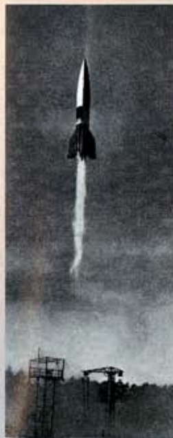
Proeflancering van een V2 in Peenemünde in 1944