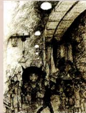
In Dora : dwangarbeid in de ondergrondse V2-fabriek

In 1944-45 hebben de vliegende V1 bommen en de V2 raketten angst gezaaid in Londen en Antwerpen en de dood veroorzaakt van duizenden personen. De door het team van von Braun in het uiterst geheime centrum van Peenemünde ontwikkelde V2's, werden door de gedeporteerden van het concentratiekamp Dora gefabriceerd.