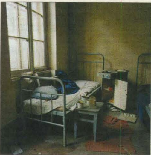
Slaapzaal in kasernie Grimma, Sachsen.