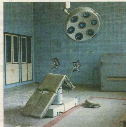
Militair Hospitaal, Jüterbog, Brandenburg.